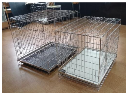
参考（左：コアXL-tサイズ 右：他社XLサイズ）