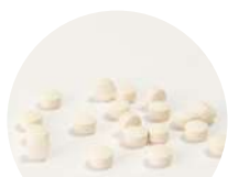
直径5mmの小粒タイプ