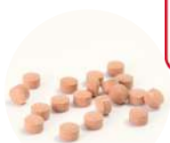
直径5mmの小粒タイプ